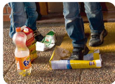
Pappersförpackningar är roliga att platta till!