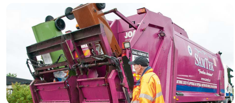
"Feta Trisse" har ett fack för brännbart avfall och ett för matavfall.