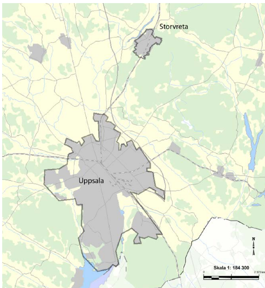
Figur 2. Den geografiska omfattningen av hämtningsområde 2.